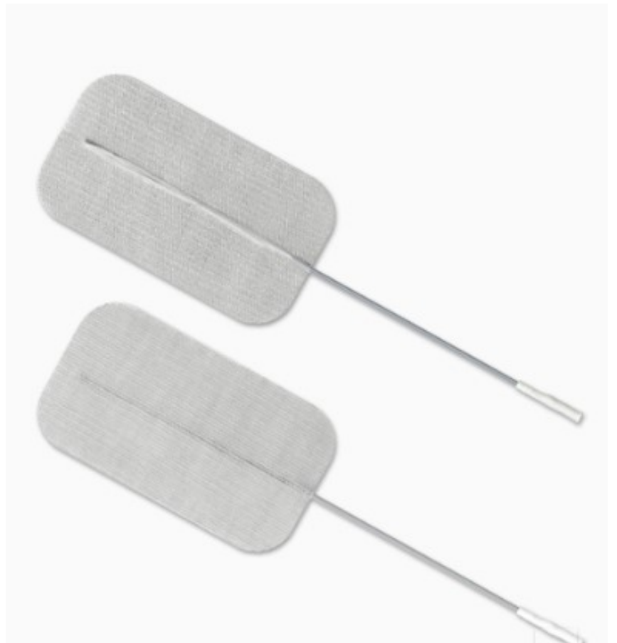
895250 PALS RECTANGULAR 2.0" X 5.0" (5CM X 13CM )