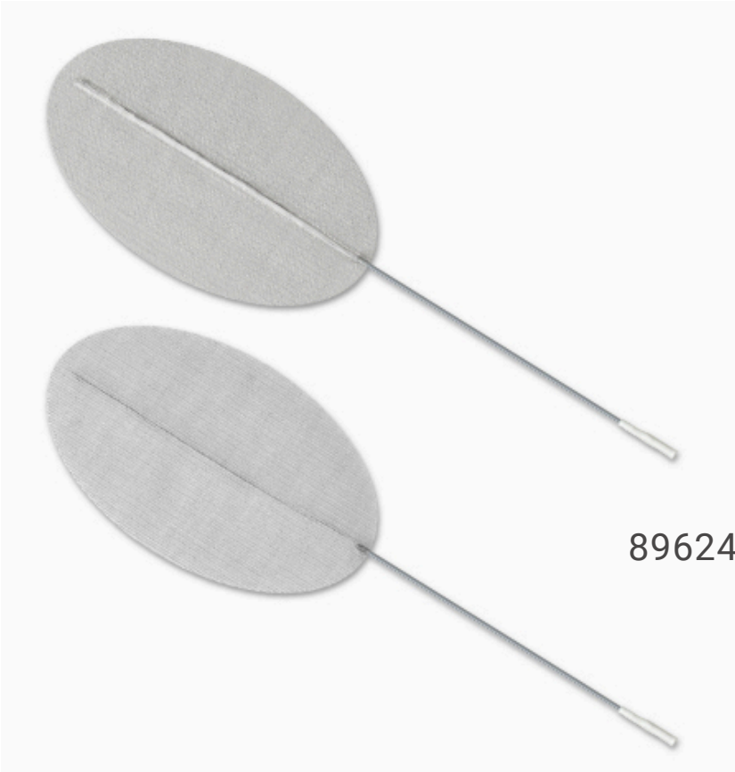
896240 PALS OVALADO 2.0" X 4.0" (5CM X 10CM)